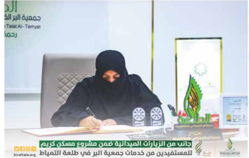
جانب من الزيارات الميدانية ضمن مشروع مسكن كريم للمستفيدين من خدمات جمعية البر في طلة التمياط