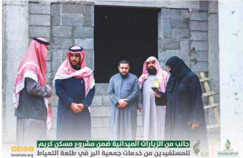
جانب من الزيارات الميدانية ضمن مشروع مسكن كريم للمستفيدين من خدمات جمعية البر في طلة التمياط